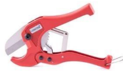
Nůžky na plasty