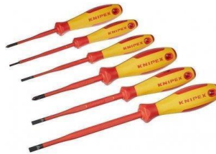
Sada izolovaných šroubováků 3x plochý + 3x křížový