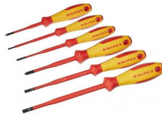
Sada izolovaných šroubováků 3x plochý + 3x křížový