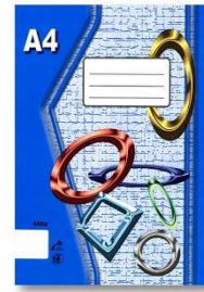
Sešit A4 nelinkovaný