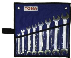
Sada maticových klíčů 8 – 30