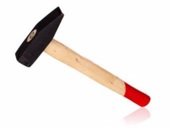
Kladívko 500–600 g