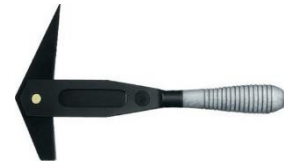
Pokrývačské kladivo na břidlici