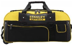
Brašna na nářadí v přiměřené velikosti