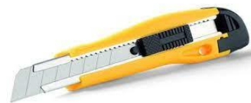
Pracovní odlamovací nůž