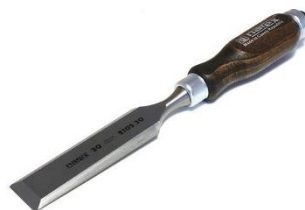
Ploché dláto 20mm