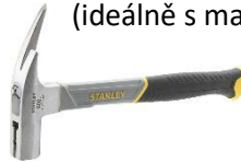
Pokrývačské kladivo 600g (ideálně s magnetem)