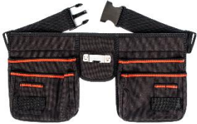
Opasek s kapsami na spojovací materiál